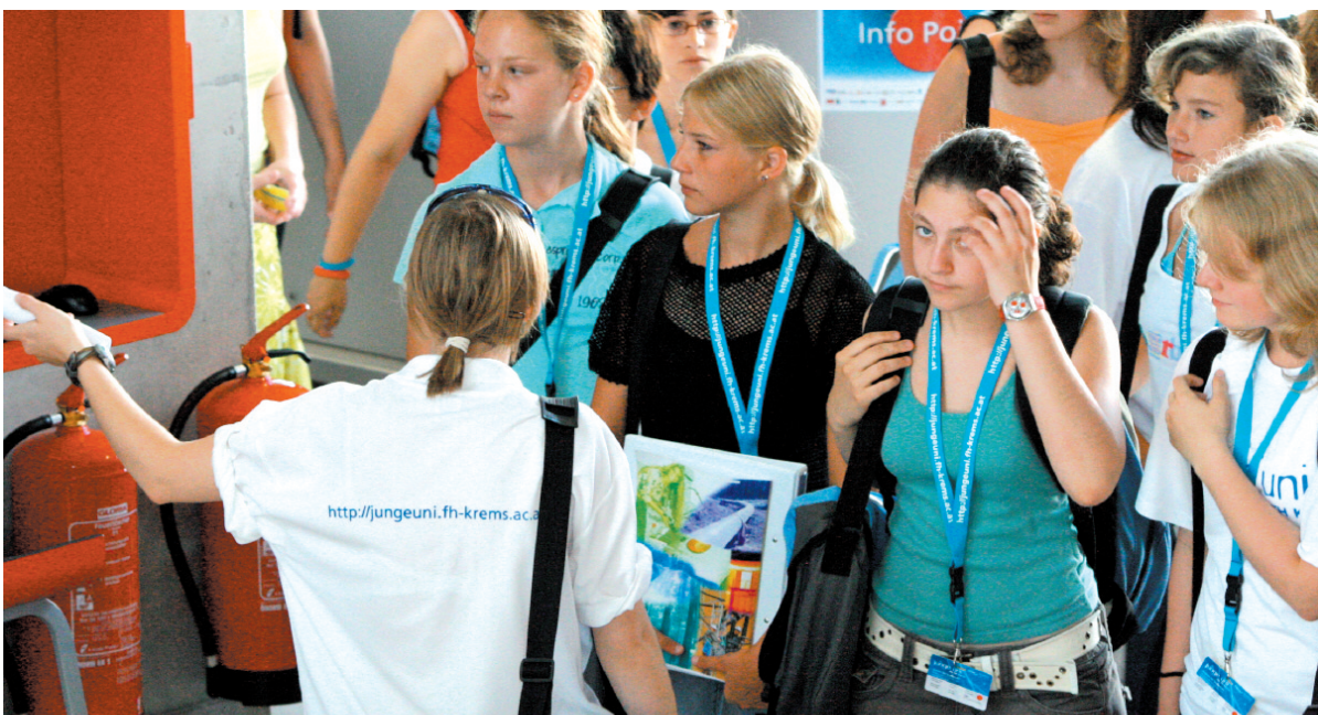
Früh übt sich, wer ein Meister werden will: 250 Schüler konnten eine Woche Wissenschaft schnuppern.

IMC Fachhochschule Krems: Jugendliche im Alter zwischen elf und 14 Jahren konnten an der ersten Jugenduniversität Niederösterreichs eine Woche lang in die Welt der Wissenschaft hineinschnuppern.